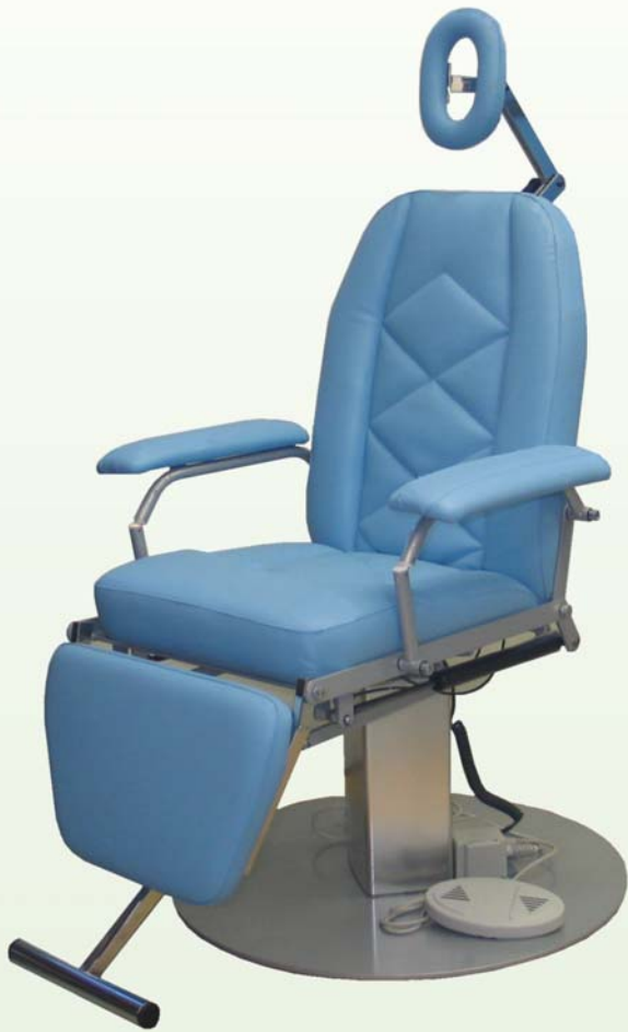
Tutkimustuoli 5010 Verhoilu 8567 vaalean sininen