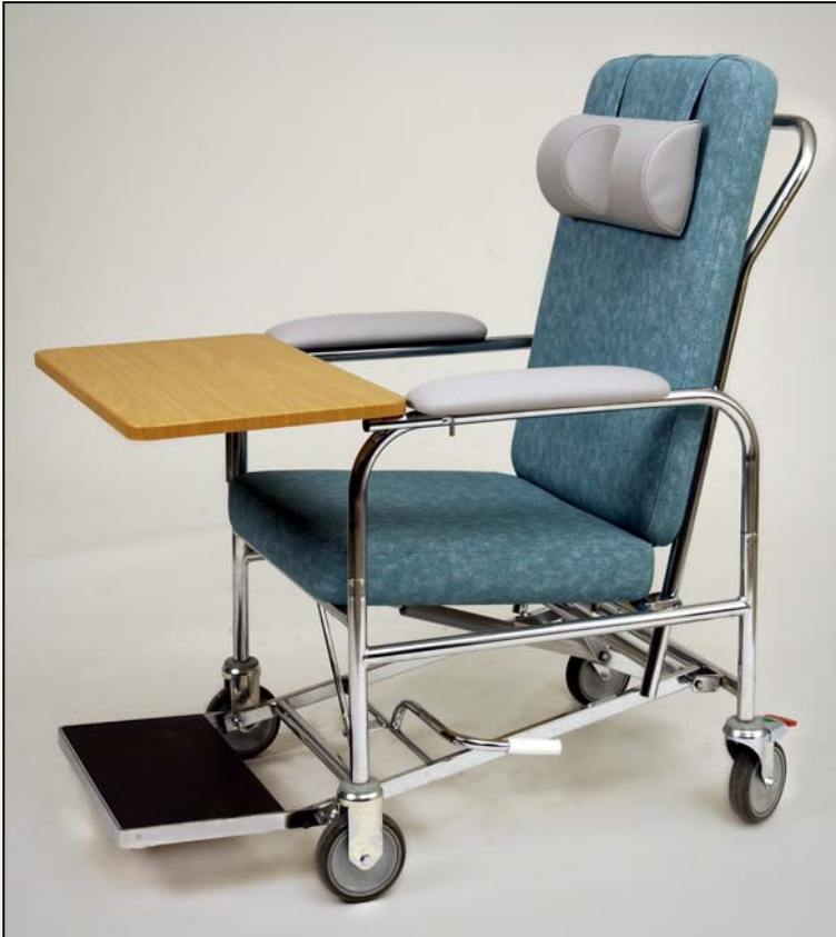
Geriatrinen tuoli 5100