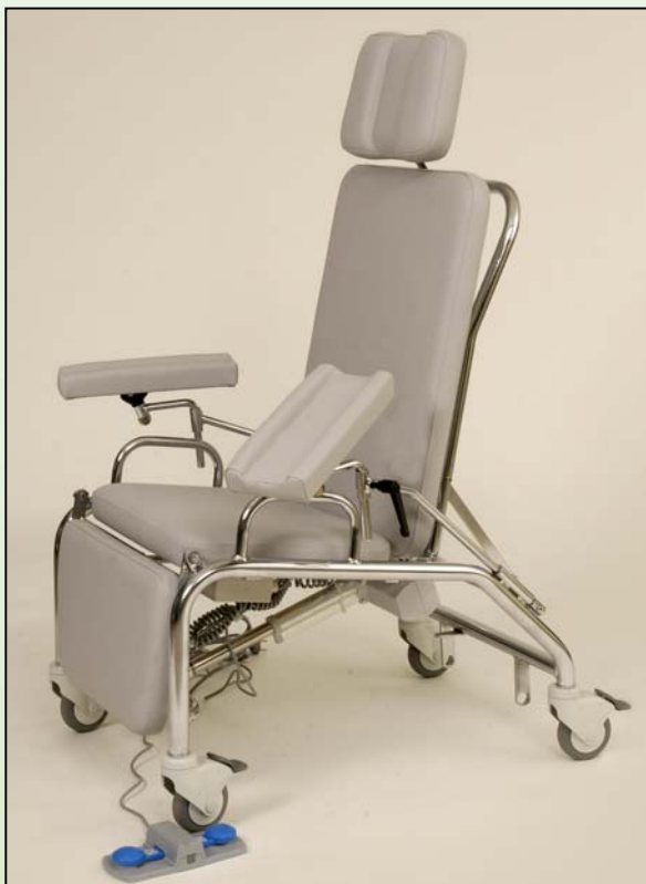
Näytteenottotuoli 5200S Sähkötoiminen Väri 3331 vaalean harmaa

Tuolit soveltuvat laboratoriotutkimuksiin. Kolmiosainen rakenne ja istuimen säädöt helpottavat niin potilasta, kuin hoitajaakin. Molemmiin puolin tuolia on säädettävät näytteenottotuet. Niiden korkeutta, etäisyyttä ja kallistuskulmaa voidaan säätää portaattomasti. Lisäksi tuet säätävät selkänojan mukana, kun selkänojaa lasketaan tai nostetaan. Näytteenottotuet on mahdollista myös irrottaa kokonaan. Näytteenottotuolit säätävät Trendelenburg –asentoon. Mallissa 5200 säätö tapahtuu portaattomasti kaasujousen keventämänä. Selkäosan mukana säätyy myös jalkatuki ylös. Sähkötoimisessa mallissa 5200S selkänoja säätyy sähköisesti. Tällöin selkänojaa ei tarvitse avustaa käsin alas. Näytteenottotuolit on varustettu ø100 mm tukevilla täysjarrupyörillä. Verhoilu on helposti puhdistettavaa ja kestävää keinoahkaa, jonka paloluokitus on SL1. Näytteenottotuolit on saatavissa kymmenissä eri väreissä. Tuote on CE –merkitty.