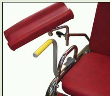
Nousutuki tuoliin Tuote nro. 5201

Vakiovarusteena ø100 mm, harmaa jälkiä jättämätön, lankasuojilla varustettu, tarkkuuskuulalaakeroitu jarrupyörä.