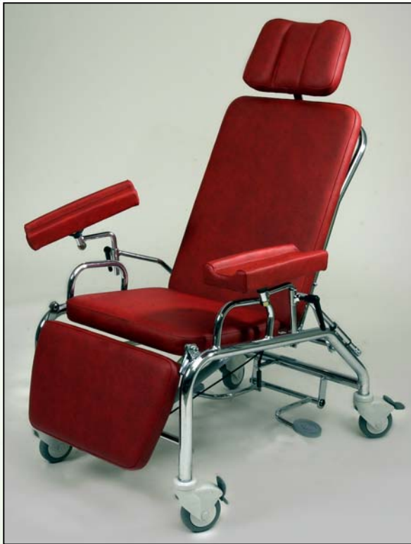
Näytteenottotuoli 5200 Kaasujousitoiminen Väri 3345 Punainen